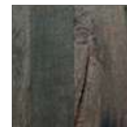
Rovere Ossidato 0ZX