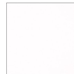
Bianco Assoluto ONR